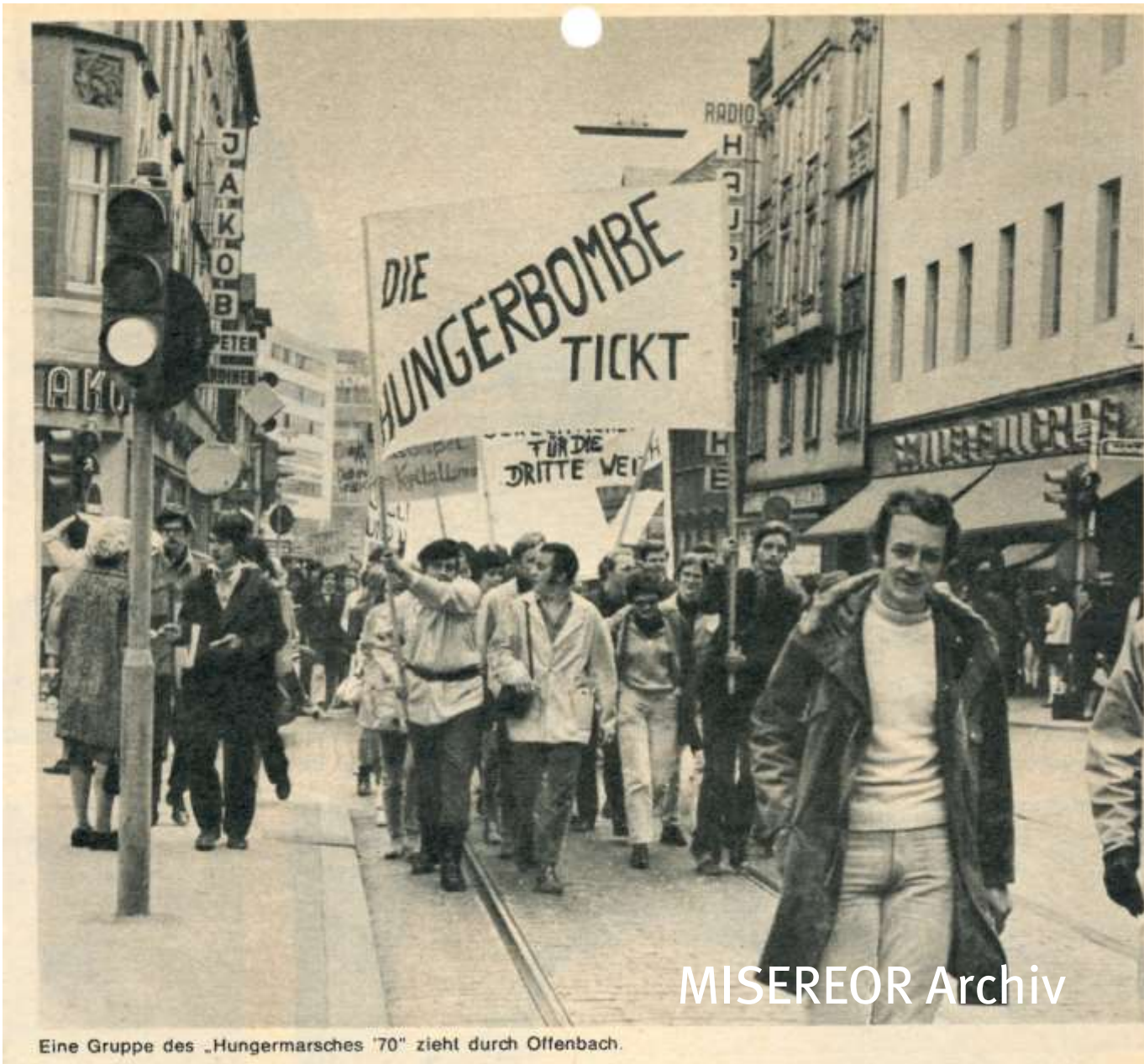
Eine Gruppe des „Hungermarsches '70“ zieht durch Offenbach.